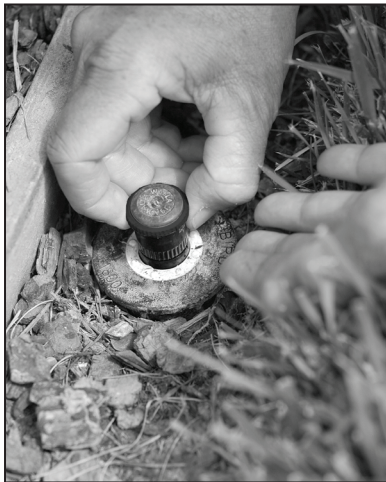
1. Pull up existing pop-up spray head and unscrew to remove

One of the simplest ways to make your watering more efficient is to retrofit your existing pop-up spray heads to pop-up rotating nozzles. Rotating nozzles are designed to water more precisely, using about 20% less water than spray heads. These nozzles shoot multi-trajectory, rotating streams that apply water more slowly and uniformly than conventional sprinklers.