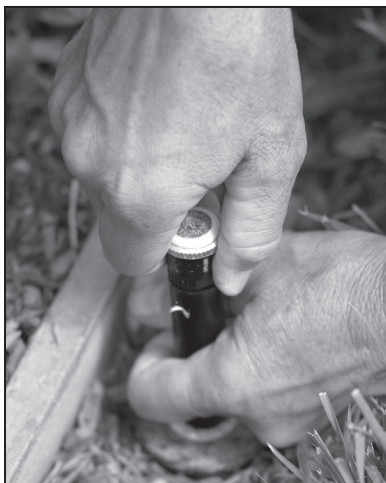
3. Screw in new rotating nozzle