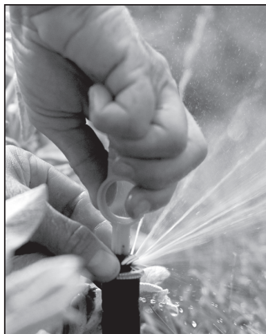
4. Adjust the nozzle head to minimize over spray