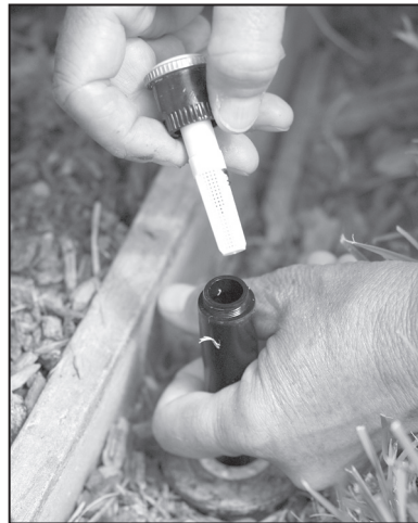
2. While in the pop-up position, put the new rotating nozzle in place